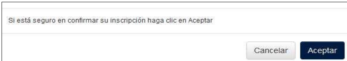
Figura 10 Confirmación del Registro

A continuación, hacer clic en el botón “Registrar” y aparecerá la Figura 10