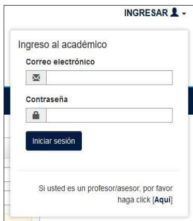
Figura 4 Ingreso al Sistema