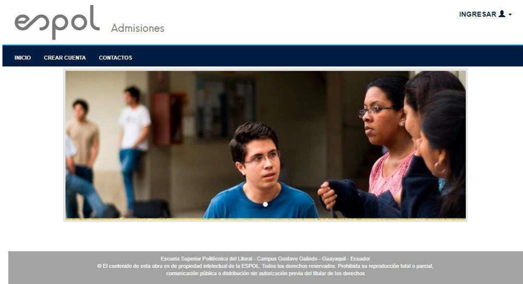
Figura 1 Pantalla Inicial de Admisión-ESPOL.

Para ingresar a la Plataforma del Académico en línea debe ingresar en su navegador la siguiente dirección: http://academico.admision.espol.edu.ec/ , A continuación en la Figura 1, se muestra la imagen de bienvenida del sistema. Luego dar clic en “Crear Cuenta”.